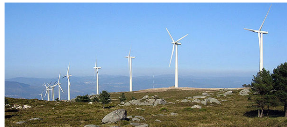
Un parque eólico en España.