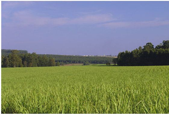
Cultivo de caña de azúcar en Brasil (Estado de São Paulo)

El alcohol derivado del maíz, la caña de azúcar, el mijo, etc. es también una energía renovable . Igualmente los aceites de plantas y semillas pueden ser usados como sustituto del diésel que no es renovable . El metano también es considerado una fuente de energía renovable .